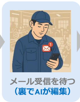
メール受信を待つ (裏でAIが編集)